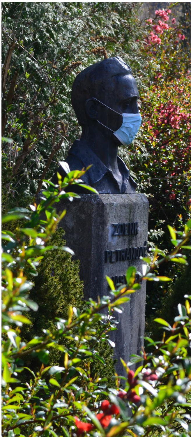
Spomenik Zdenku Petranoviču - Jastrebu, Brod na Kupi, 5. travnja 2021.