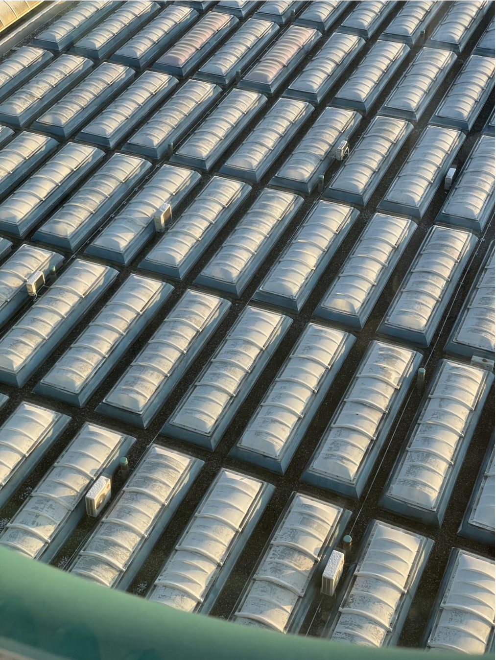
Pogled s prozora sobe za izolaciju na hematološkom odjelu u KB Dubrava, Zagreb, 12. prosinca 2022.