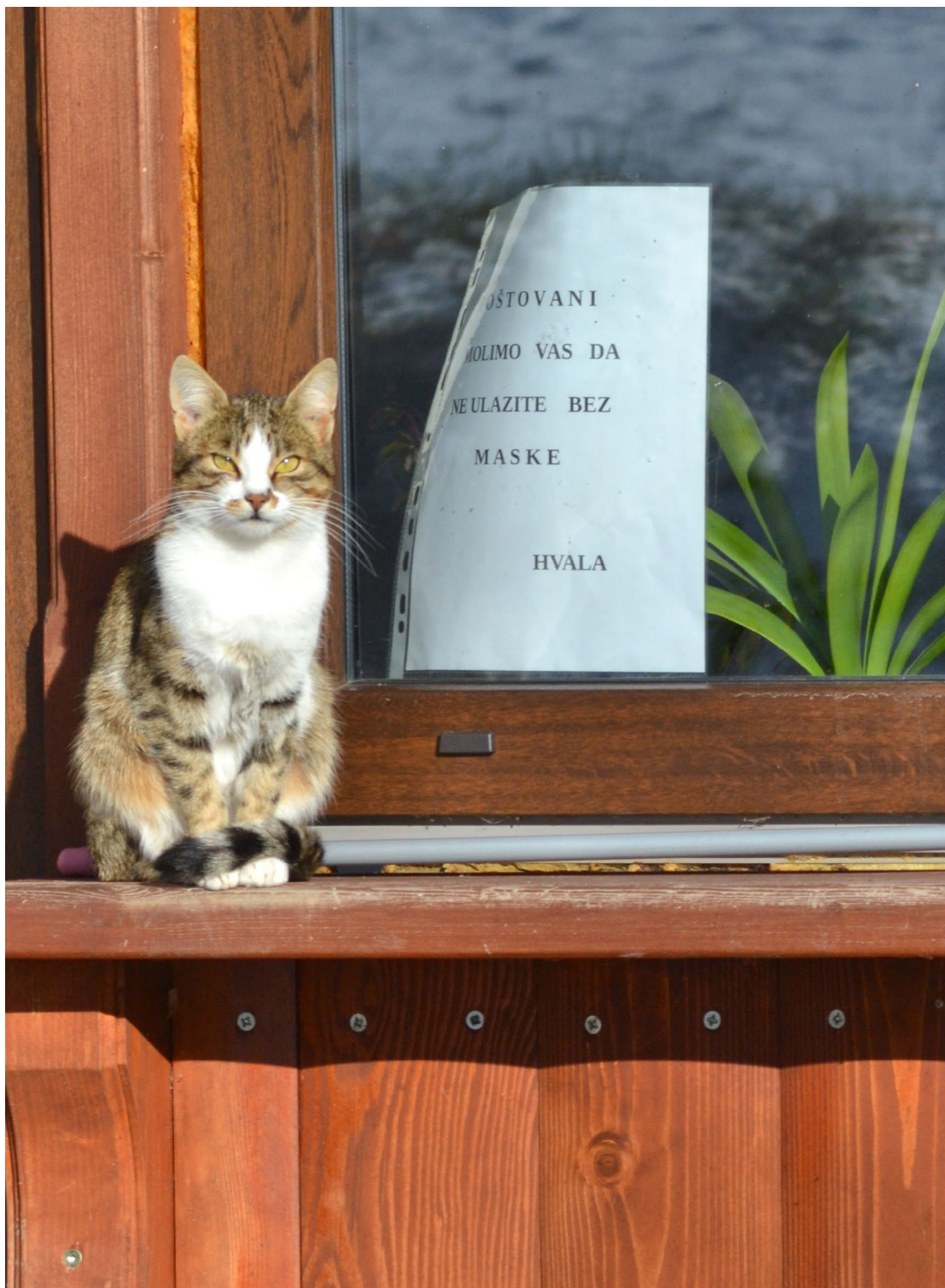
Begovo Razdolje, 22. studenog 2020.