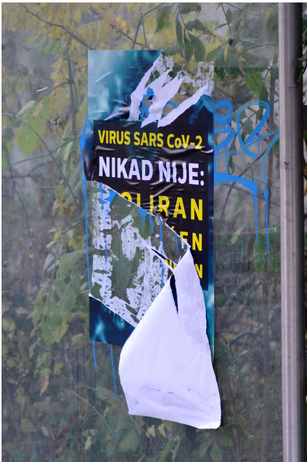
Autobusna stanica, Susedgrad, Zagreb, 13. studenog 2021.